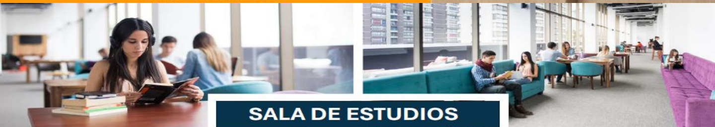
SALA DE ESTUDIOS