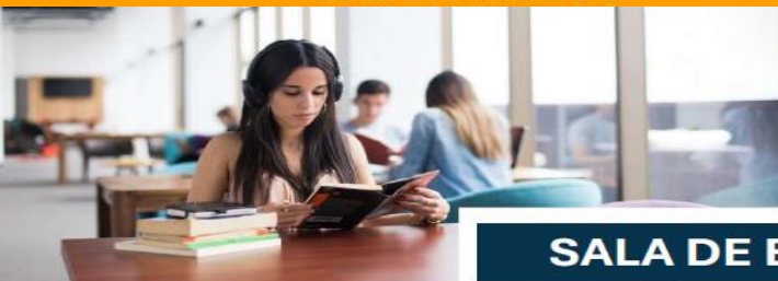
SALA DE ESTUDIOS