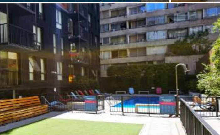
BBQ & PISCINA