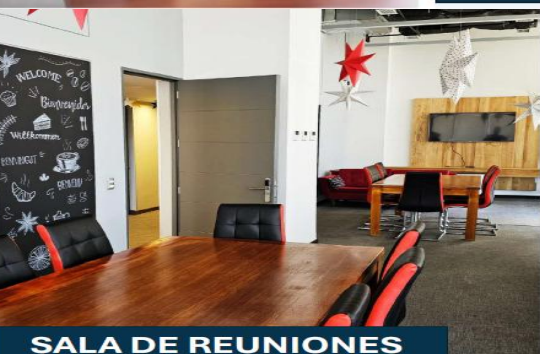
SALA DE REUNIONES