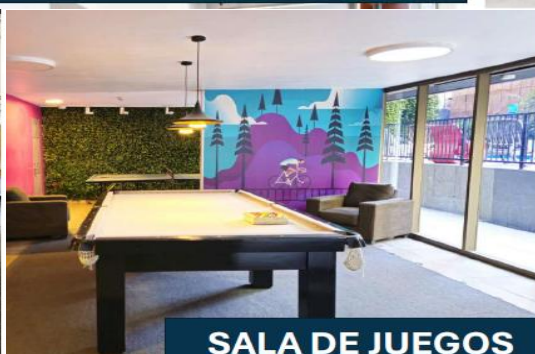
SALA DE JUEGOS